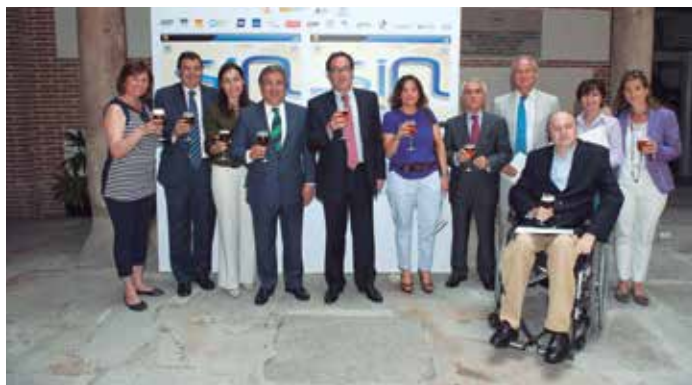
El primer convenio con la Asociación Cerveceros de España se suscribió en 2012 (en la imagen, los firmantes y organizadores en el acto celebrado tras la firma de aquel primer convenio)