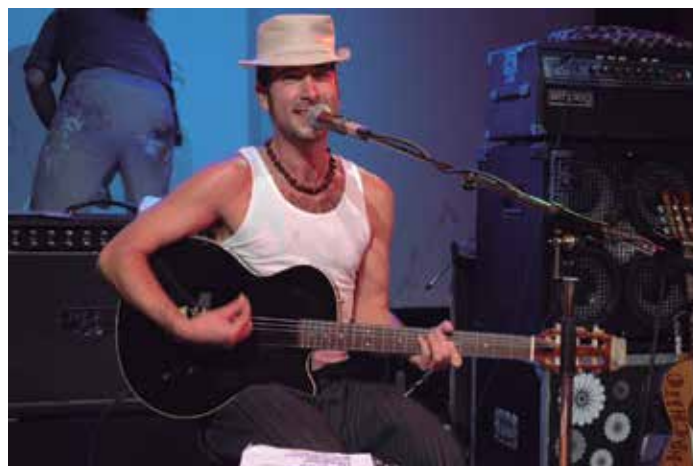
El acuerdo ha permitido aliviar el impacto de las cantidades reclamadas por la SGAE por el uso del repertorio protegido por el derecho de autor.