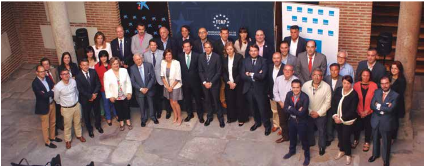
El Presidente de la FEMP, en el centro junto a los patrocinadores, con los directores de los seminarios y los alumnos de la primera edición del seminario Liderazgo político y Comunicación, al finalizar el acto de presentación.