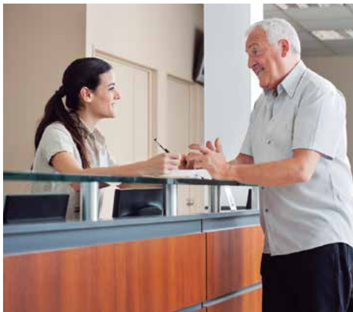
La Administración Local deberá disponer medios que garanticen el acceso de las personas a la información.