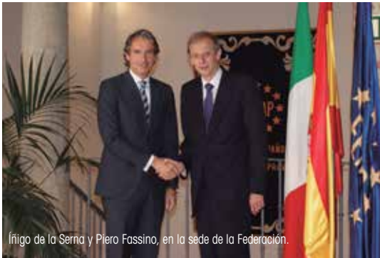
Íñigo de la Serna y Piero Fassino, en la sede de la Federación.

El Presidente de la FEMP, Íñigo de la Serna, y su homólogo de la Asociación Nacional de Municipios Italianos (ANCI), y Alcalde de Turín, Piero Fassino, estudiaron líneas de colaboración en el marco de la reunión celebrada en la sede