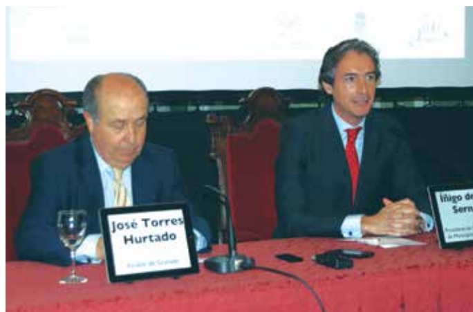
El Alcalde de Granada acompañó al Presidente de la FEMP en la rueda de prensa.

El Presidente del SCB, por su parte, destacó el incremento de reuniones en 2013 en las ciudades que son destino de congresos y jornadas, y avanzó que todo apunta a que 2014 podría ser un buen año. El Alcalde de Granada comentó que España es la tercera nación de mundo en cuanto a lugar de celebración de reuniones de negocios y que esto de-