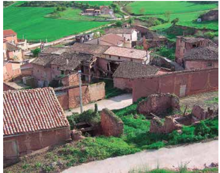
A la hora de calcular el coste efectivo, la FEMP sugiere que se tengan en cuenta diferentes particularidades locales, como la densidad de población, la orografía, o la edad de los residentes, entre otros factores.

Uno de los puntos que resultan más complejos, por lo que a coste efectivo se refiere, es la determinación de las pautas que permitan contemplar determinadas peculiaridades municipales para asegurar una comparación más homogénea a la hora de realizar el cálculo. En este sentido, y frente al contenido del proyecto presentado por el Gobierno, la FEMP propone que, para hacer más realista el cálculo, se contemple la media ponderada de los tres últimos ejercicios, en lugar de ceñirse tan sólo al ejercicio anterior. También sugiere que se tengan en cuenta las diferentes particularidades locales, como la temporalidad, el incremento de población flotante, la densidad de población, la orografía, o la edad de los residentes para poder comparar de manera más homogénea.