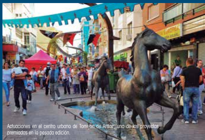
Actuaciones en el centro urbano de Torrejón de Ardoz, uno de los proyectos premiados en la pasada edición.