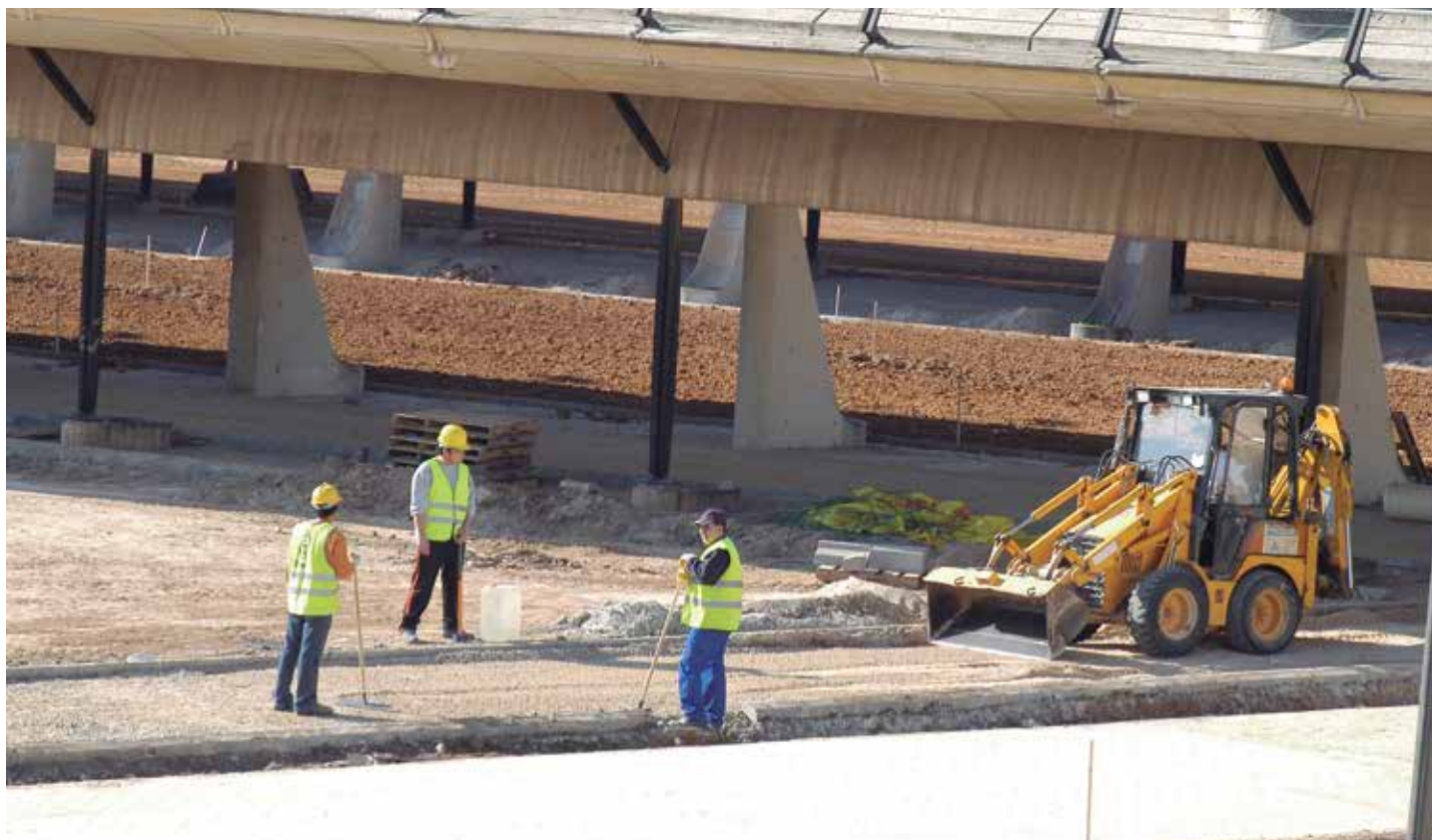
La construcción de infraestructuras deja de ser un objetivo prioritario de nuevo marco financiero plurianual de la UE. Ahora, lo principal es incrementar la productividad y la competitividad y promover el empleo.

También, a petición expresa de la Comunidad de Extremadura, se incluyó la ITI (Inversión Territorial Integrada, una nueva figura de los Fondos Estructurales para resolver un problema específico de un ámbito territorial concreto) "Industrialización Extremadura" , mediante la creación de unas zonas de especial atención industrial repartidas por todo el territorio extremeño, denominadas "Polos Industriales" . ★