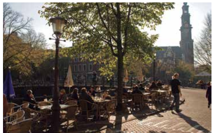
Finlandia y Holanda (en la imagen, calles de Helsinki, a la izquierda, y de Ámsterdam), junto con Dinamarca y Lituania son los Estados de la Unión en los que se aplica plenamente el principio de colaboración entre Gobiernos Nacionales y Locales.