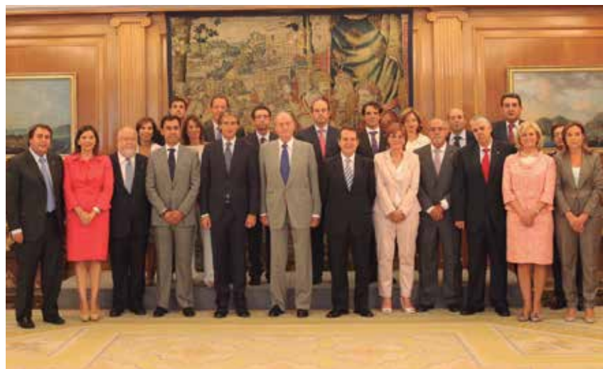
A la izquierda, el Rey entrega a Mariano Rajoy el escrito de abdicación. En la otra imagen, la Junta de Gobierno de la FEMP recibida por el Monarca en septiembre de 2012.