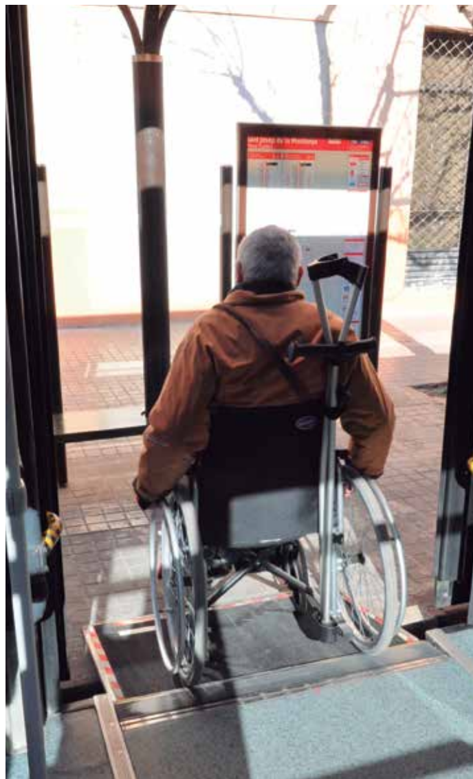
El convenio contempla la elaboración de una Guía práctica.

La nueva jornada prevista para este año, en el marco del convenio de colaboración, incidirá en el objetivo de revisión de los métodos de trabajo clásicos y en el planteamiento de respuestas desde una visión colegiada. Del mismo modo, profundizará en la importancia de acometer un trabajo coordinado en la planificación del urbanismo, la accesibilidad y la movilidad, para lo cual el papel de los municipios resulta fundamental. ★