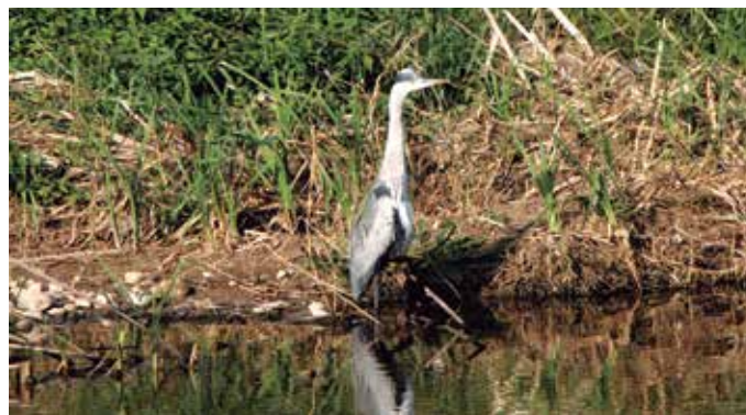
El Día Internacional de la Diversidad Biológica estuvo dedicado a las islas y áreas marinas.

El Convenio sobre la Biodiversidad Biológica (CDB) se aprobó en 1992 en la Cumbre de la Tierra de Río de Janeiro y entró en vigor al año siguiente. Cubre la diversidad biológica a todos los niveles: ecosistemas, especies y recursos genéticos. También cubre la biotecnología y todos los dominios que están directa o indirectamente relacionados con la diversidad biológica y su papel en el desarrollo, desde la ciencia, la política y la educación a la agricultura, los negocios y la cultura, entre otros muchos. ★