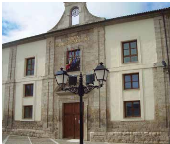
La Ordenanza ayudará a convertir a los Ayuntamientos en entidades más transparentes y abiertas.

El Gobierno Abierto se basa en la transparencia para llegar a la participación y la colaboración. A juicio de los redactores del texto, el nuevo escenario social y de relación surgido de la revolución de las TIC hace que el Gobierno que no rinde cuentas ante el ciudadano no queda legitimado ante éste. La proximidad de la Administración Local a sus vecinos y el