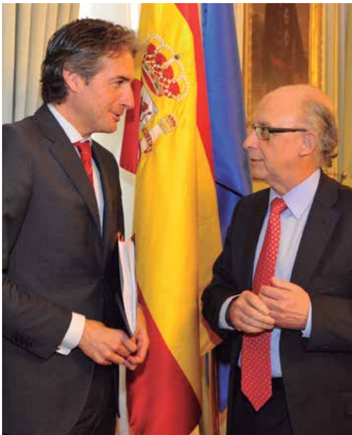
El Presidente de la FEMP y el Ministro de Hacienda, al finalizar la última Comisión Nacional de Administración Local, a comienzos del mes de mayo.

En la Junta también se hizo referencia a la progresión favorable experimentada por la Central de Contratación de la FEMP, una iniciativa surgida en el marco del reconocimiento que hace de la Federación la Ley de Bases de Régimen Local tras las modificaciones introducidas por la Ley de Racionalización y Sostenibilidad de la Administración Local. La Central de Contratación que ya supera las 215 adhesiones, licitará en breve siete nuevos servicios (más información en las páginas 62 a 66 de esta misma edición).