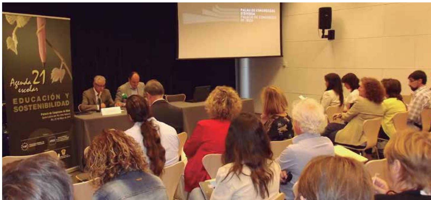
Imagen de las jornadas.

La ponente, que subrayó el papel "central" que ha de jugar la educación para lograr este cambio y el valor de la Agenda 21 Escolar, subrayó algunos elementos básicos para afrontar la situación, entre ellos una "alfabetización ecológica" que ayude a comprender los ecosistemas en los que vivimos, educar en el principio de suficiencia y austeridad, estimular la cooperación y el trabajo conjunto, y finalmente revertir el sistema, "en el que, de forma mayoritaria el poder económico no apuesta por salidas participativas y sostenibles" .