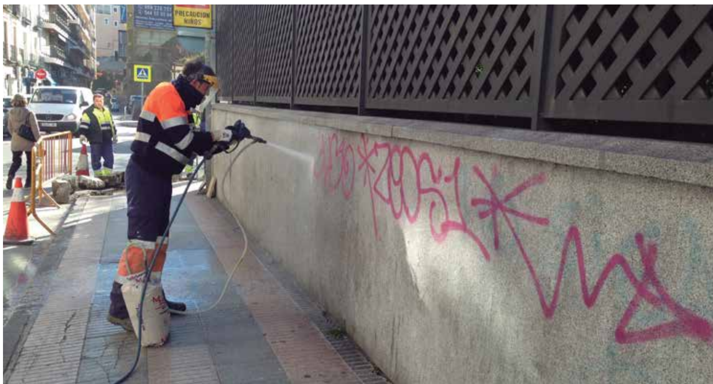
La FEMP suscribirá un nuevo acuerdo con el Ministerio del Interior de cara a seguir impulsando el cumplimiento de penas de trabajo en beneficio de la comunidad.

Asimismo, se informó el Acuerdo de cooperación entre el Programa de las Naciones Unidas para los Asentamientos Humanos (ONU-HABITAT) y la FEMP, que hará posible la organización del taller "Tecnologías