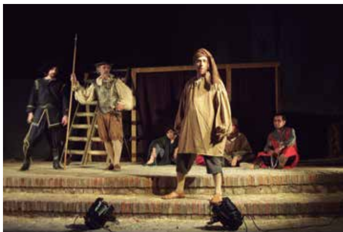
Representación teatral en Villa de Don Fadrique (Toledo)

Los datos del estudio muestran también que el 85% de las Entidades Locales afectadas respondieron al planteamiento formulado por la SGAE y la FEMP y que de todas ellas sólo un 19%, 566 Ayuntamientos, dieron una respuesta negativa.