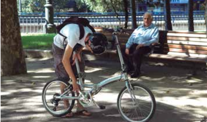
La bicicleta y la movilidad sostenible protagonizan buena parte de los proyectos escogidos.

Una página Web y una aplicación móvil gratuita que facilita la geolocalización de plazas de aparcamiento para personas con movilidad reducida, es la iniciativa presentada para Alicante. Se denomina Disabledparky está pensada principalmente para cuando estas personas se desplazan fuera de su ciudad.