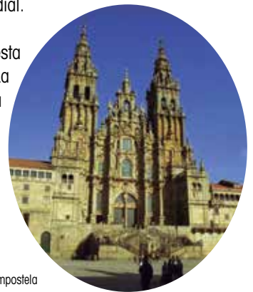
Catedral de Santiago de Compostela

La cantidad total prevista para esta convocatoria es de 700.000 euros. La cuantía máxima individual no podrá superar el 75% del coste estimado del proyecto. La información completa sobre esta convocatoria puede consultarse en el apartado "CONVOCATORIAS" de la web de la FEMP ( www.femp.es ).