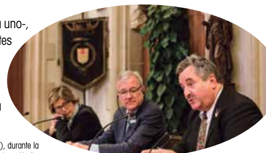
Mercedes Bresso (izquierda) y Ramón Luis Valcárcel (en el centro), durante la conmemoración del centenario de la I Guerra Mundial, celebrado en Yprés.

Los miembros del Comité se reunirán en sesión plenaria el próximo 26 de junio en Bruselas para determinar quiénes asumirán las funciones de Presidente y Vicepresidente. Esta sesión también coincidirá con la celebración del vigésimo aniversario del Comité.