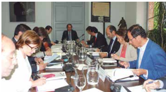
Reunión de la última Junta de Gobierno, el 27 de mayo

En su intervención, el Presidente de la FEMP también tuvo palabras de recuerdo para la fallecida Presidenta de la Diputación de León, Isabel Carrasco (ver cuadro). ★