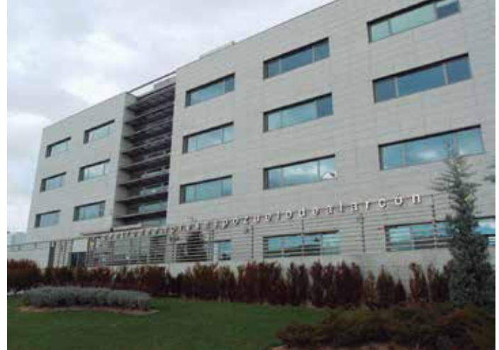
Pozuelo de Alarcón es una de las nuevas ciudades de la RECI.

Por último, Urban M (Málaga), es una bicicleta eléctrica inteligente que incorpora un motor de asistencia para favorecer el transporte rápido, cómodo y sin esfuerzo en determinadas circunstancias. Es plegable y fácilmente transportable, de manera que puede introducirse en casa, en el bus y en la oficina. Además, reconoce a su propietario y procesa los datos de distancia, velocidad, calorías consumidas, etc. ★