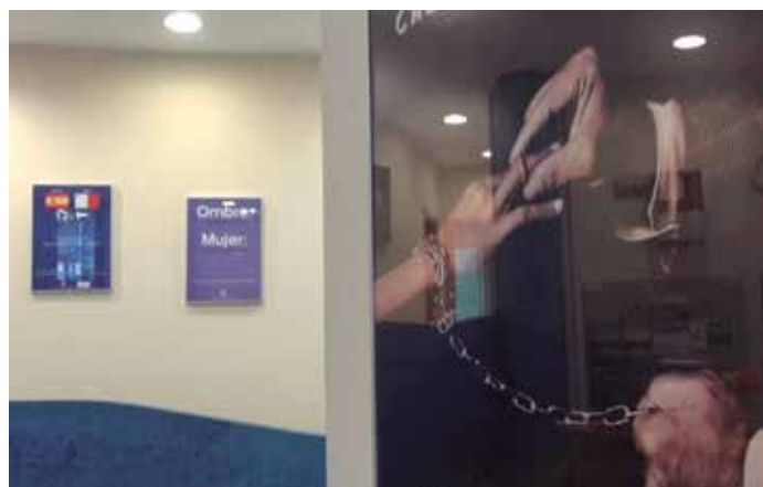
Centro Municipal del Atención Integral a la Mujer del Ayuntamiento de Oviedo.

Según el Ayuntamiento, se ha pretendido asegurar un acceso equitativo a los distintos servicios y promover la igualdad entre mujeres y hombres, mejorando la seguridad ciudadana y asegurando condiciones de vida inte-