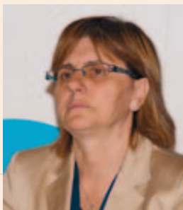
Pilar Varela Díaz, Alcaldesa de Avilés