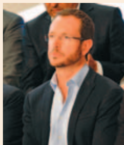
Javier Maroto Aranzábal, Alcalde de Vitoria-Gasteiz