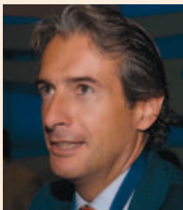
Iñigo de la Serna Hernáiz, Alcalde de Santander