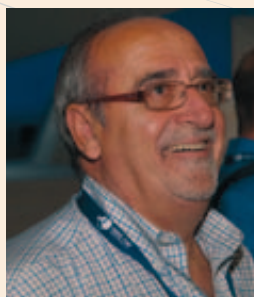
José Masa Díaz, Alcalde de Rivas Vaciamadrid