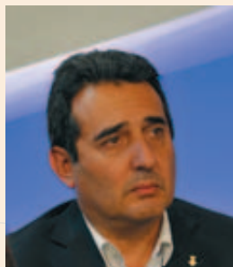
Manel Bustos Garrido, Alcalde de Sabadell