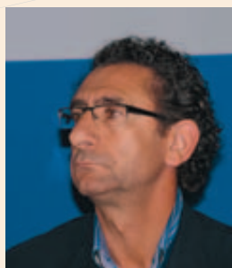
Joaquín Peribáñez Peiró, Alcalde de Calamocha