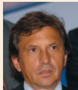
Mateu Isern Estela, Alcalde de Palma de Mallorca