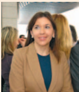
Mercedes Alonso García, Alcaldesa de Elche