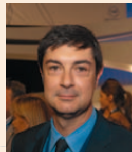
Juan Ávila Francés, Alcalde de Cuenca