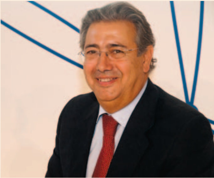
Presidente Juan Ignacio Zoido Álvarez

Nació en Montellano (Sevilla), el 21 de enero de 1957; está casado y tiene 3 hijos. Licenciado en Derecho por la Universidad de Sevilla.