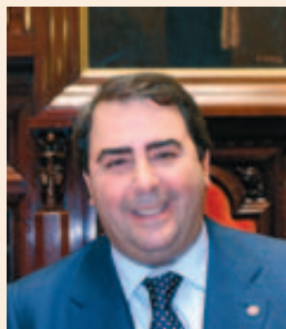
Carlos Negreira Souto Alcalde de A Coruña