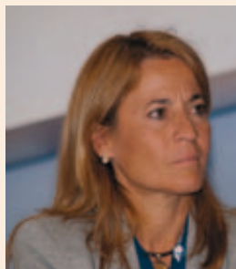
Elena Nevado del Campo, Alcaldesa de Cáceres