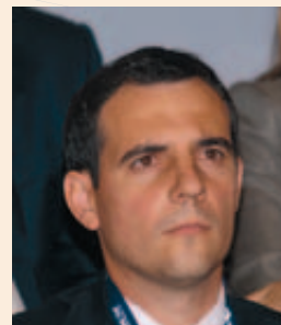
Manuel Reyes López, Alcalde de Castelldefels