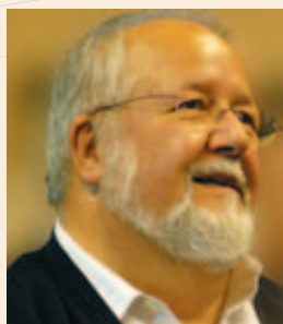
Salvador Esteve Figueras, Presidente de la Diputación de Barcelona