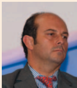
Pedro Rollán Ojeda, Alcalde de Torrejón de Ardoz