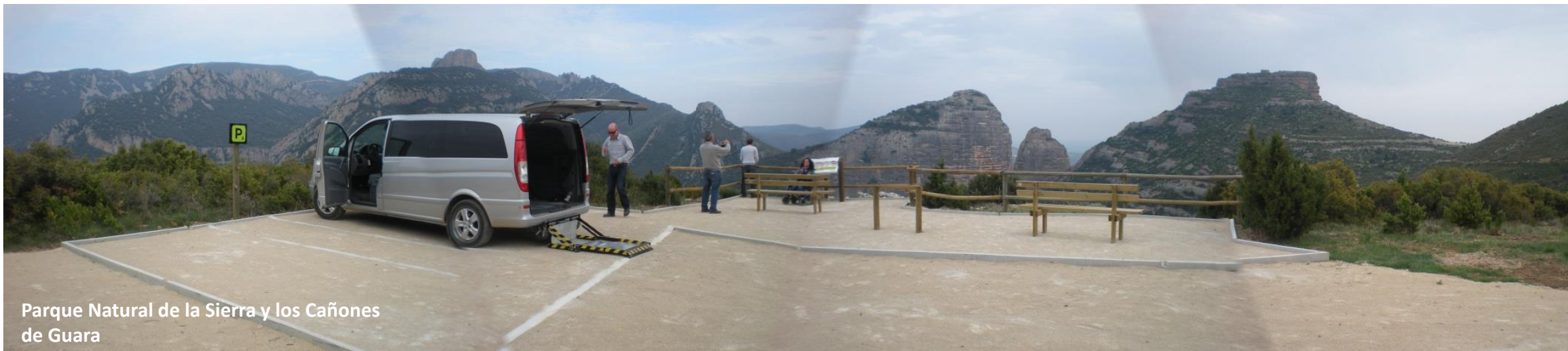
Parque Natural de la Sierra y los Cañones de Guara