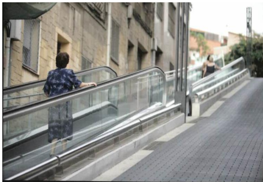
SANTA COLOMA (Barcelona)