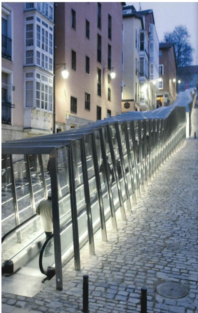
CENTRO MEDIEVAL VITORIA