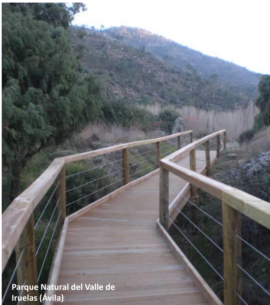
Parque Natural del Valle de Iruelas (Ávila)