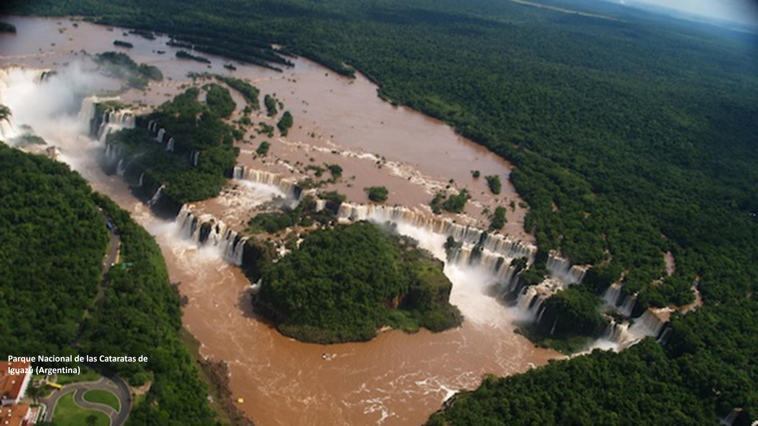
Parque Nacional de las Cataratas de Iguazú (Argentina)