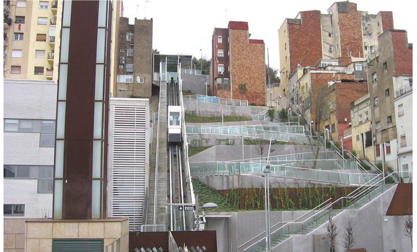
Ascensor funicular en el barrio El Carmelo (BARCELONA)