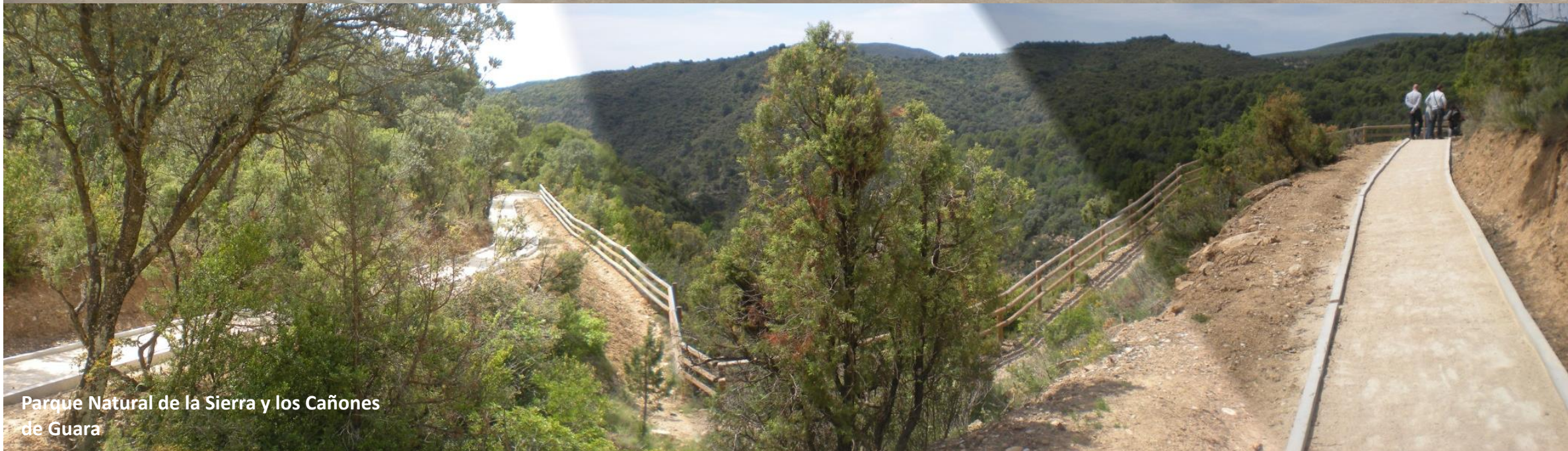
Parque Natural de la Sierra y los Cañones de Guara