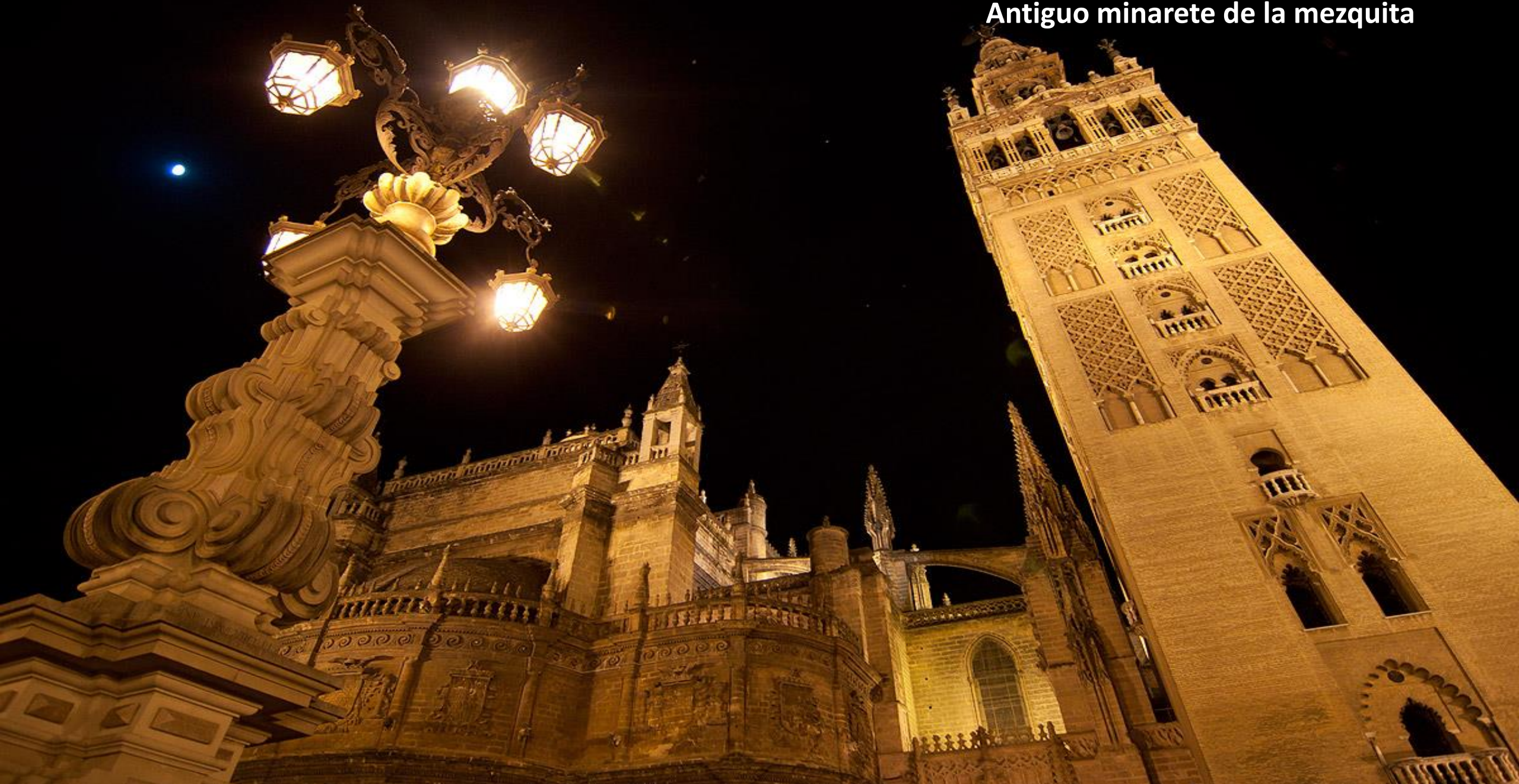
Torre de la catedral de Sevilla. Antiguo minarete de la mezquita