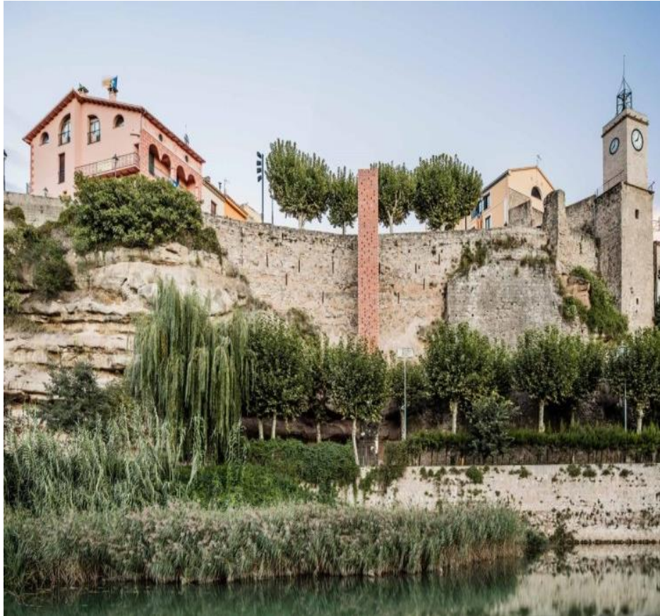
Ascensor en Gironella de Carles (BARCELONA)