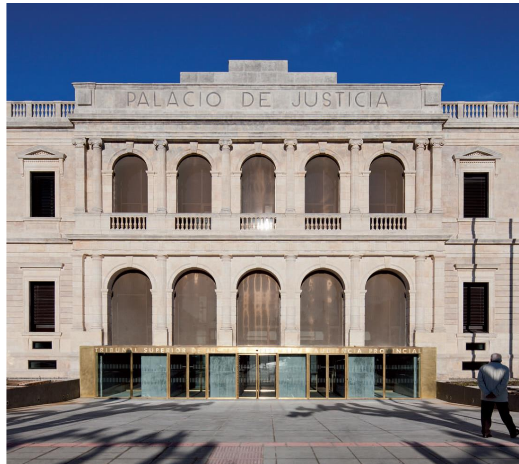
Palacio de Justicia de Burgos. Primitivo González. Arquitecto