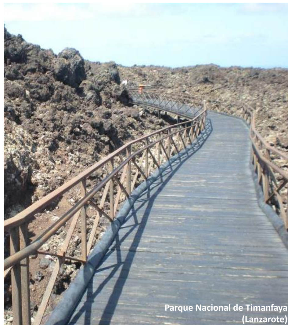
Parque Nacional de Timanfaya (Lanzarote)

...utilizando los materiales adecuados para cada entorno.